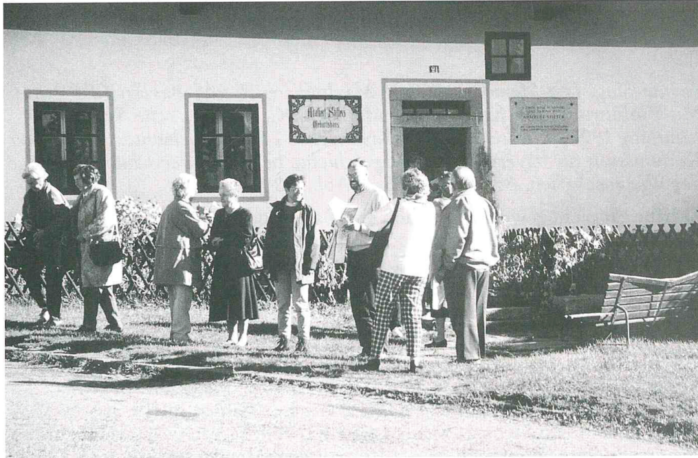
Abb. 1: Teilnehmer der Südböhmen-Exkursion vor dem Geburtshaus Adalbert Stifters in Oberplan.